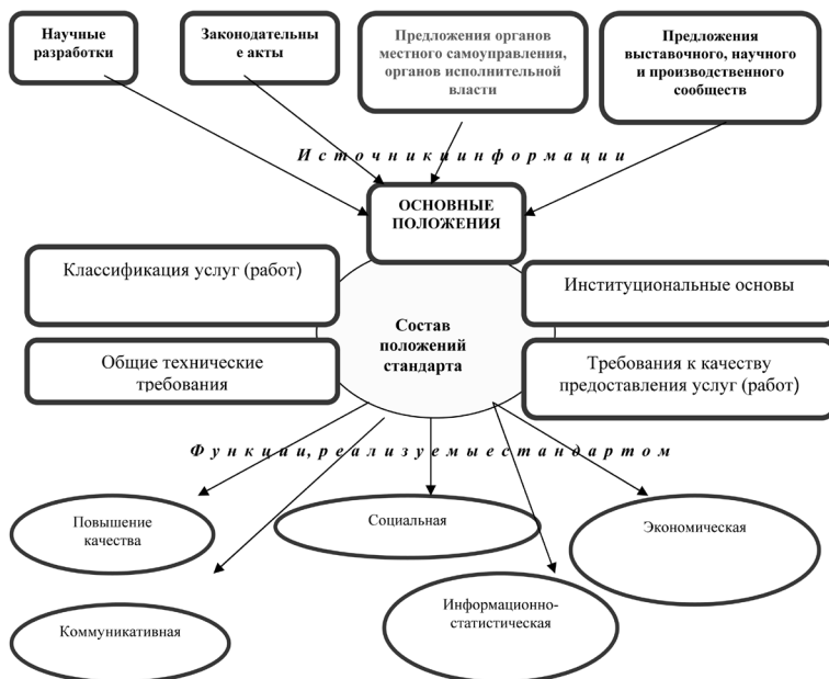
Рис. 3. Концептуальная модель национального стандарта

В настоящее время на территории Российской Федерации действуют разработанные